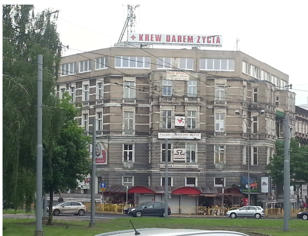
Szczecin, wrzesień 2018 r