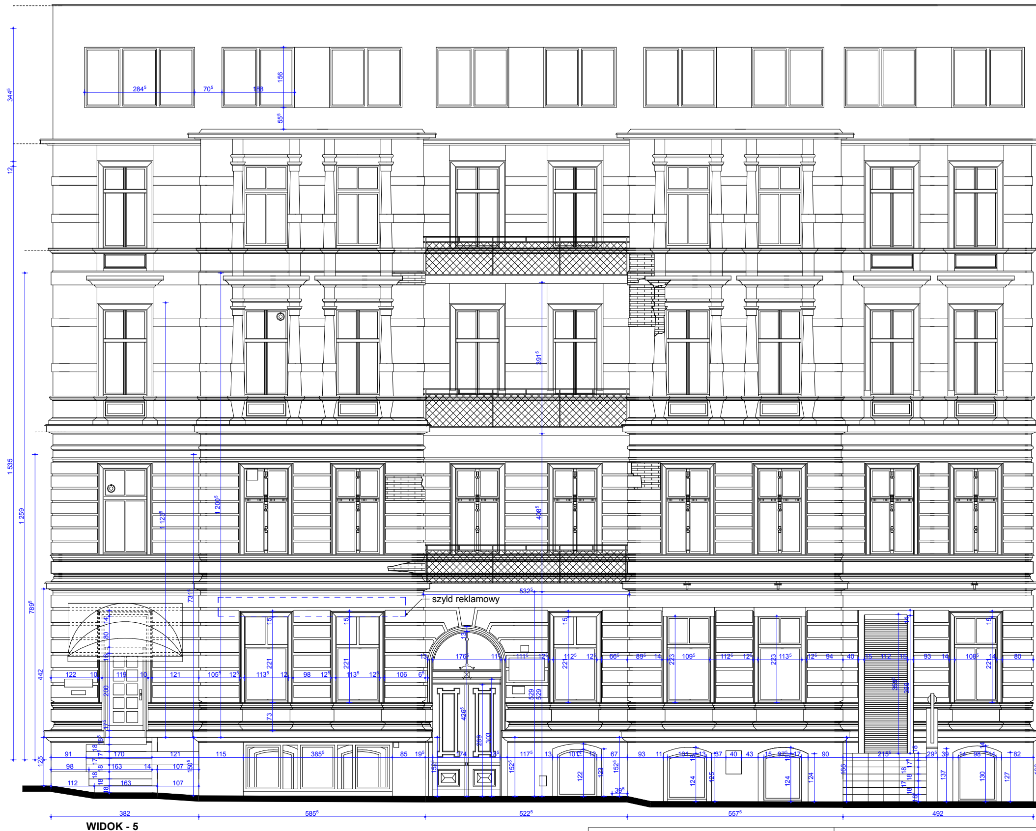
WIDOK - 5