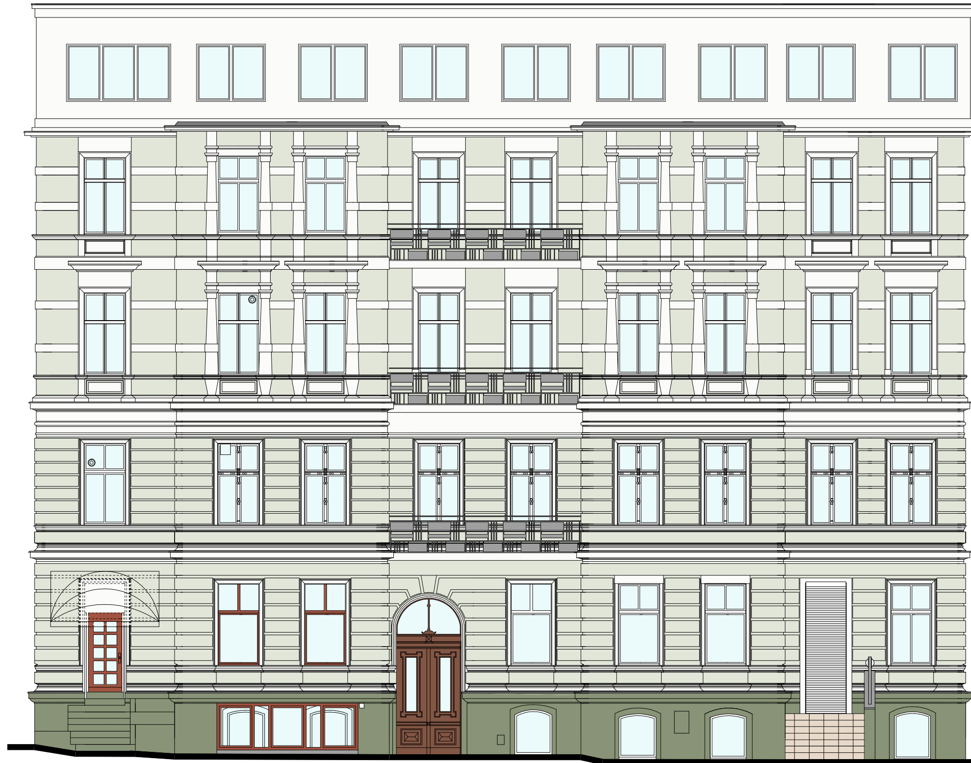
WIDOK - 5