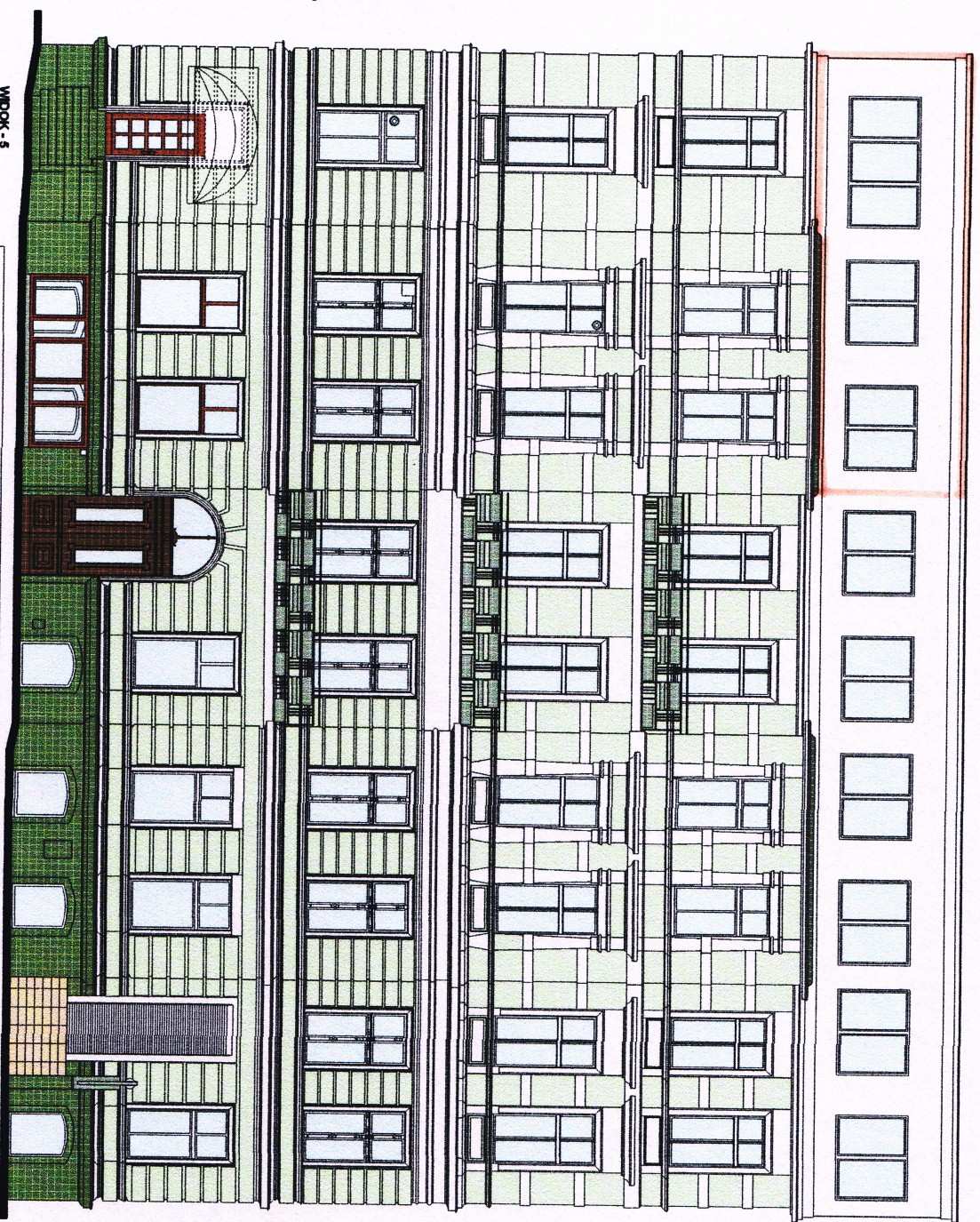
WIDOK - 5